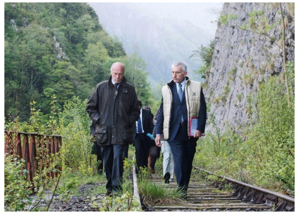
Visite d'Alain Rousset entouré des élus de la région du Béarn et de Guillaume Pépy, président de la SNCF, sur la ligne Pau-Canfranc abandonnée, le 6 mai 2009.

« Les équipes de RFF et ses partenaires techniques se mobilisent dès maintenant pour réaliser ces travaux, en toute sécurité, dans les délais requis, en respectant le cadre de vie des habitants des communes et la qualité exceptionnelle des sites naturels traversés. »