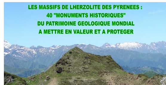
Patrimoine Géologique Mondial

Comme le disait déjà en 1899, le Directeur des Eaux et Forêts, rédacteur de la première directive qui leur était consacrée : « De tels arbres font partie de la richesse esthétique de la France. Ils ajoutent à la beauté de ses paysages, ils amènent des visiteurs dans des régions qui sans eux resteraient en dehors de l'itinéraire des touristes. Ils font aimer et apprécier nos forêts. »