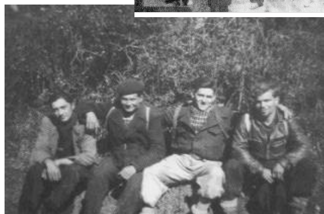
Quatre jeunes résistants du maquis du Bager.